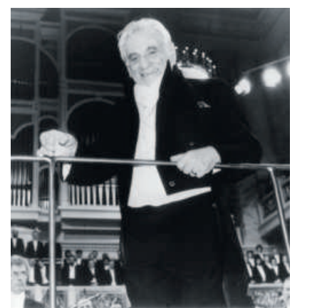
Leonard Bernstein 1989 im Berliner Konzerthaus

Das Beethoven-Haus Bonn tut es auf zweierlei Weise. Einmal besinnt es sich zurück aufs Kunstwerk selbst: Am 6. und 7. Mai findet in der Historischen Stadthalle Wuppertal eine programmatische und aufführungspraktische Rekonstruktion der Uraufführung statt. Zudem widmet sich vom 4. bis 6. Mai die Wissenschaft dem Werk in einem Internationalen Beethoven-Kongress. Andererseits wird die Wirkung der Neunten beleuchtet. Eine Sonderausstellung im Beethoven-Haus Bonn dreht sich um „Bernsteins Beethoven“ im Umkreis